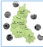
Bassin Universitaire de Reims Champagne - Ardenne